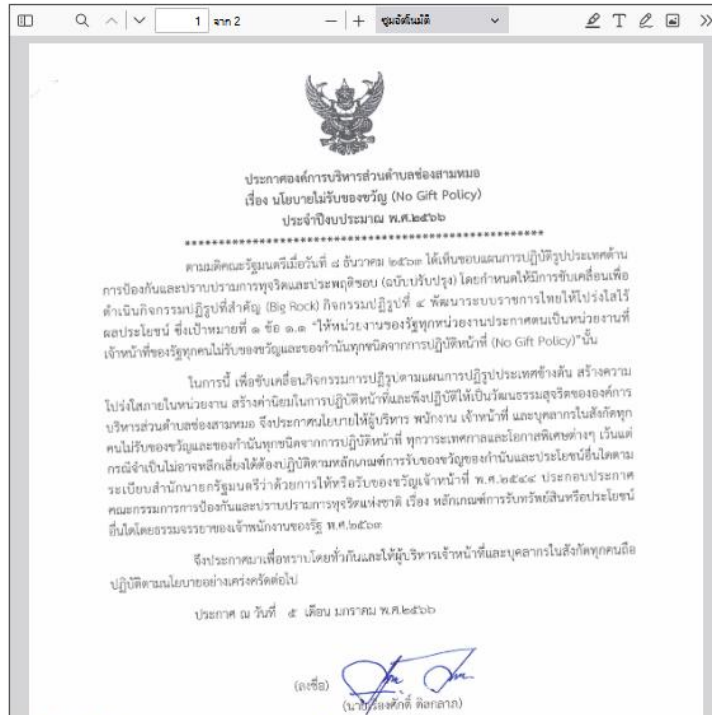
นโยบายไม่รับของขวัญ (No Gift Policy) ประจำปีงบประมาณ พ.ศ.2566

วันที่ลงข่าว : 2 ก.พ. 2566 ผู้ลงข่าว : ผู้ดูแลระบบ